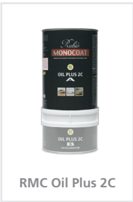
RMC Oil Plus 2C