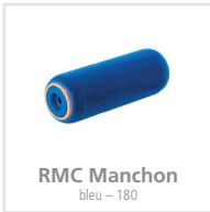
RMC Manchon bleu - 180