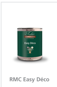
RMC Easy Déco